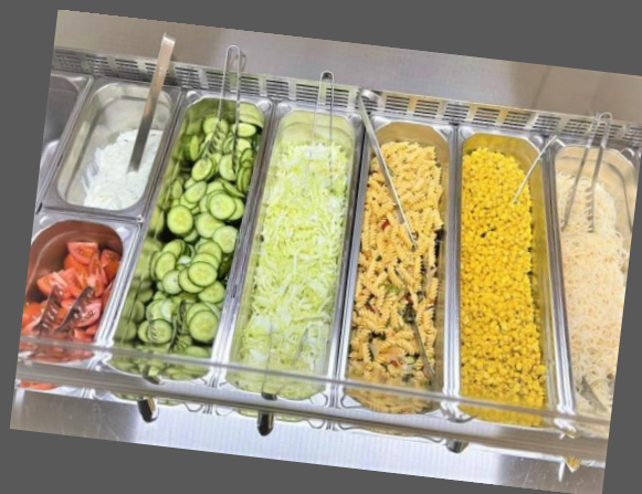
Auswahl an Gerichten